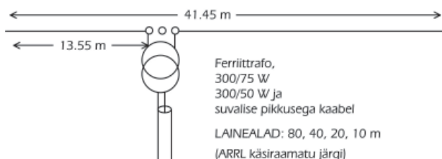
Windowantenni kabelitoitega versioon

Rothammel, Antennenbuch, uuemad väljaanded, Die Window-Antenne “