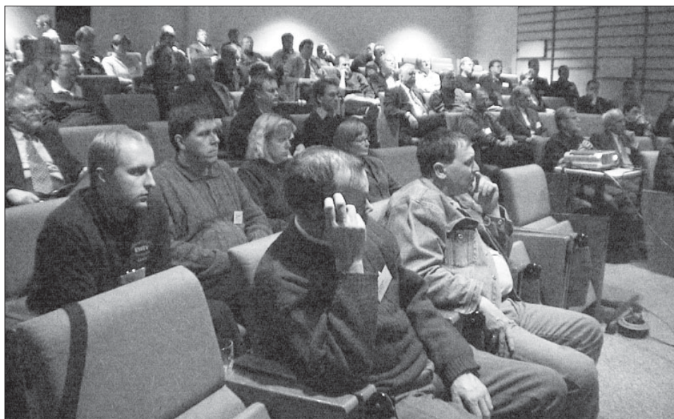
Eesti esindus kaheksandal CCF-i kokkutulekul.

Esimene ettekanne paljastas kuulajatele SO2R (üks operaatoreid, kaks raadiot) saladusi. Esinejaks oli Rus, K2UA ja esitlus edastati New Yorgist telefoni teel. Ettekandja tõi välja SO2R eelised ja andis vihjeid edukaks tööks kahe saatjaga. Samuti tõi ta veidi näiteid tehnikast, mida saab kasutada ja kui kulukaks see läheb. Selle esitluse fail on saadaval http://www.qsl.net/ccf/ccf2003/k2ua.ppt ja minu palav soovitus see huvilistel läbi sirvida.